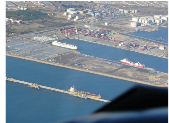
Oostkust Spanje, noord van Valencia

verder; snel verder want we willen vandaag nog naar Perpignan.