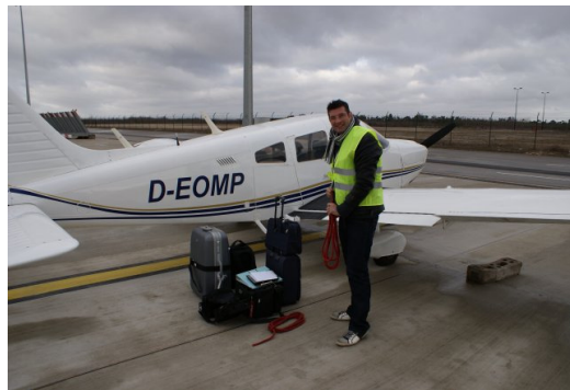
Platform Châlôn Vatry

bellen we wat hulplijnen in Nederland die wat metro-informatie voor ons kunnen bevestigen. Even na 15.00u hangen we weer, en met de wind in de rug (154kts ground speed) zijn we snel in Chalon waar we op W5 mogen parkeren, tussen twee oude cargo 747's van Air France.