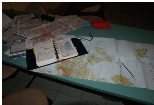
Vluchtvoorbereiding in Perpignan

de toren verzekerd hebben dat wij niet willen blijven slapen op de plek waar we nu staan, stelt ze voor dat we lopend naar het luchthavengebouw gaan. Aangezien wij dan in het donker over een onbekend veld moeten lopen en daarbij de active runway over moeten zijn wij geen voorstander van deze oplossing. De dame op de toren vraagt ons stand-by te blijven op de radio om opzoek te gaan naar een oplossing. Wanneer wij aangeven dat wij niet stand-by kunnen blijven, omdat onze accu dat niet zolang trekt wordt ze pas echt geïrriteerd. Maar uiteindelijk om 19.00 uur (2,5uur na de landing) komt er dan toch een 'follow me'-car. We slapen weer in het IBIS hotel, maar voor die tijd eten we nog even bij de pizzeria op de hoek van de straat. Erg lekker.