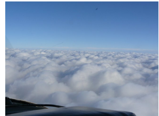
Overcast by Maastricht

De verwachten opklaringen laten alleen op zich wachten, dus bij Maastricht is het nog steeds slecht weer, OVC 400. Tevens weet Beek Approach ons te vertellen dat Lelystad ook nog dicht zit. Met dat bericht besluiten we uit te wijken naar Rotterdam, want daar is het weer al wel goed.