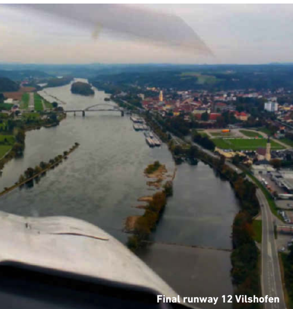
Final runway 12 Vilshofen

Ook vliegen in deze mooie Piper Archer III? Bezoek de website van Stichting Piper Pilots: www.piperpilots.nl