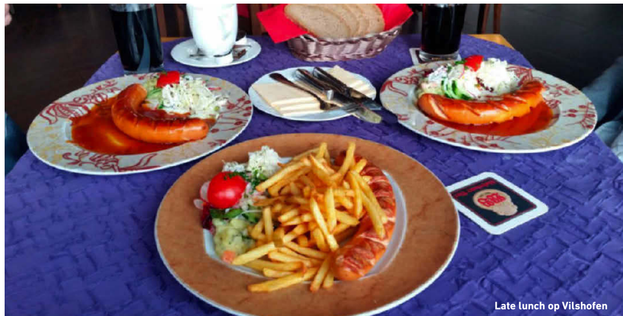
Late lunch op Vilshofen