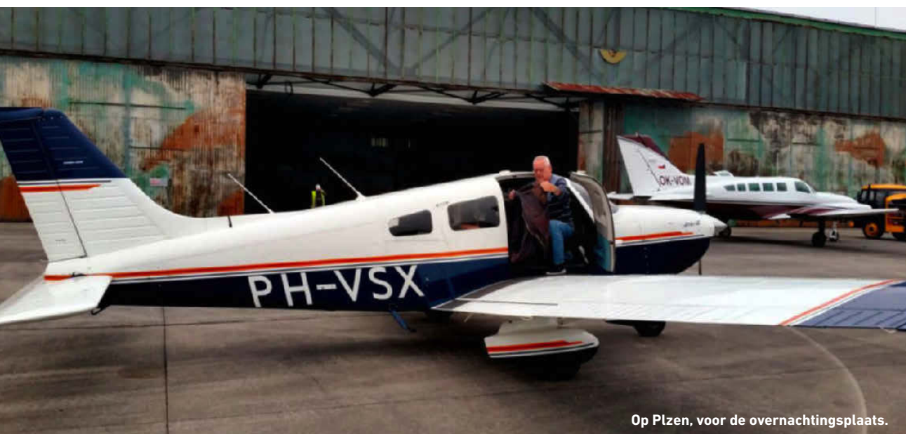
Op Plzen, voor de overnachtingsplaats.