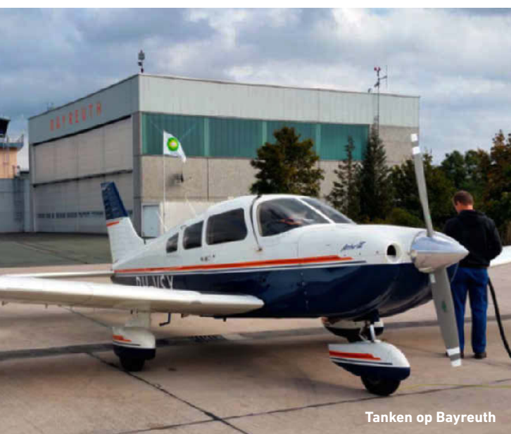
Tanken op Bayreuth